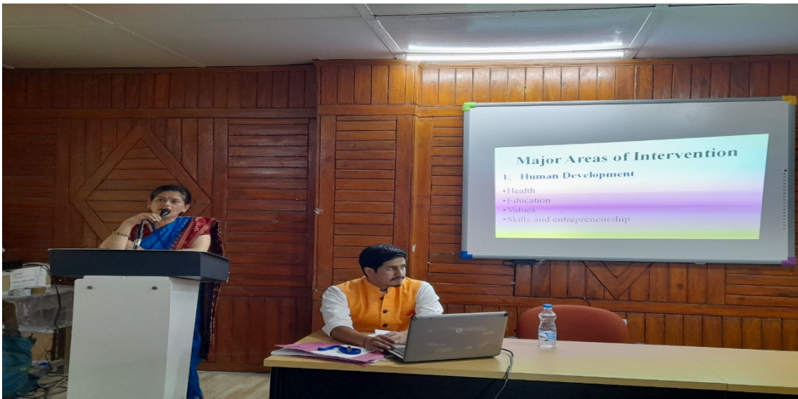
Student sensitization by UBA Team in student induction program DEEKSHARAMBH 2021