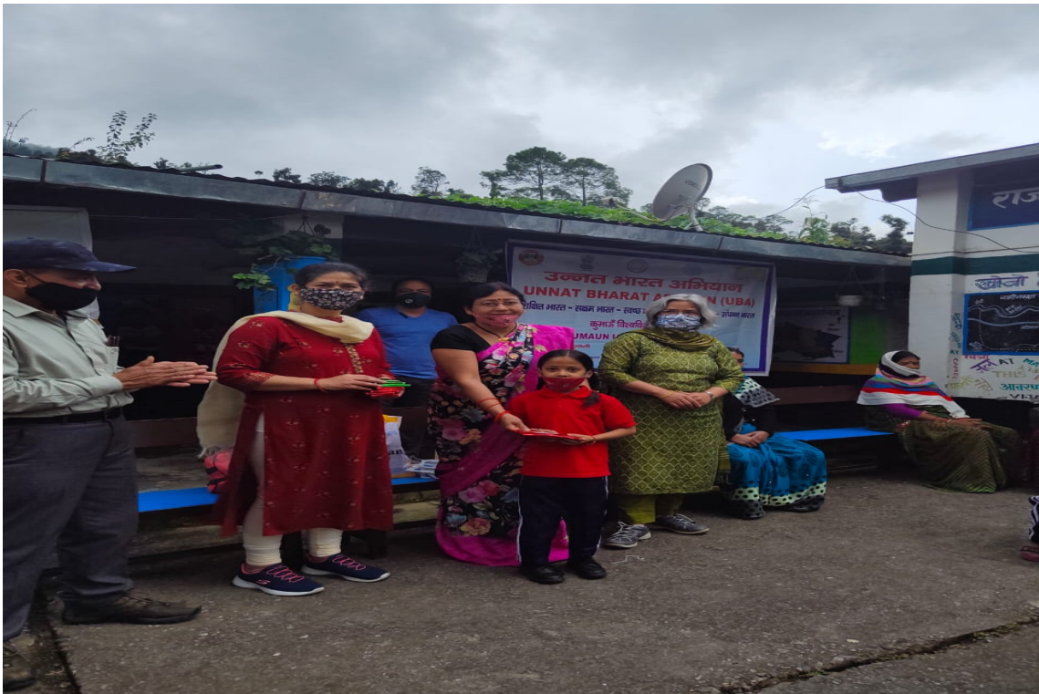
Prize distribution to students