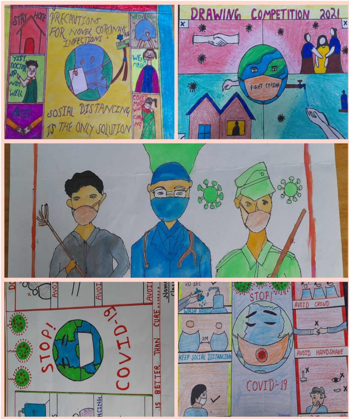
Poster making competition among students of village