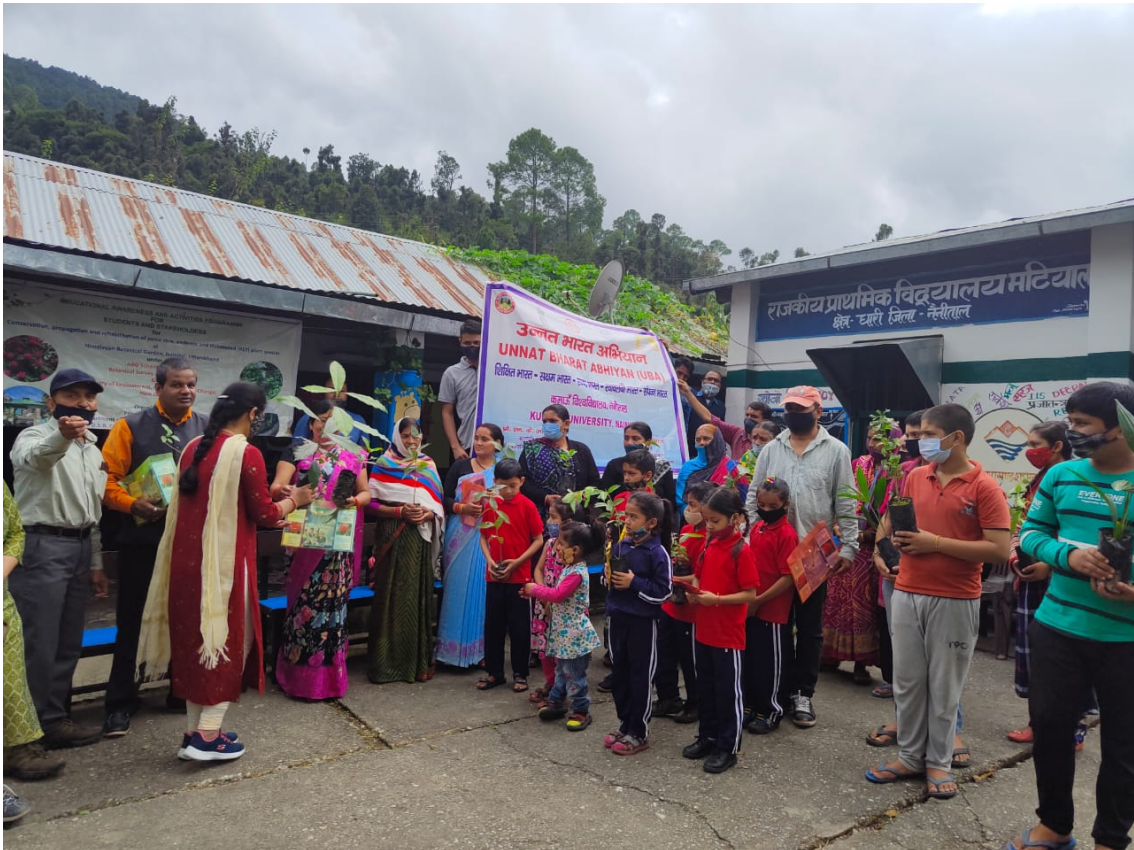
Plantation drive in villages