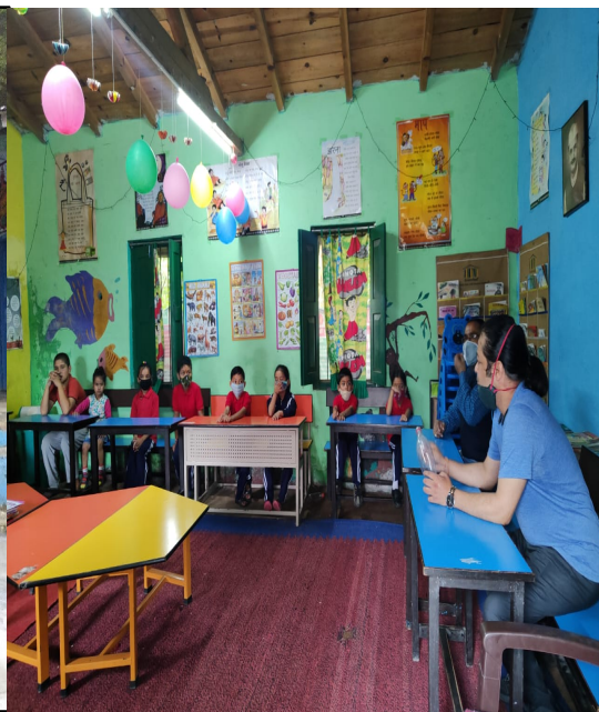
Awareness campaign for COVID-19