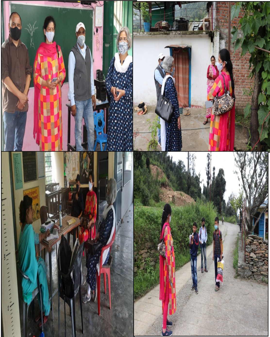
Awareness campaign for COVID-19