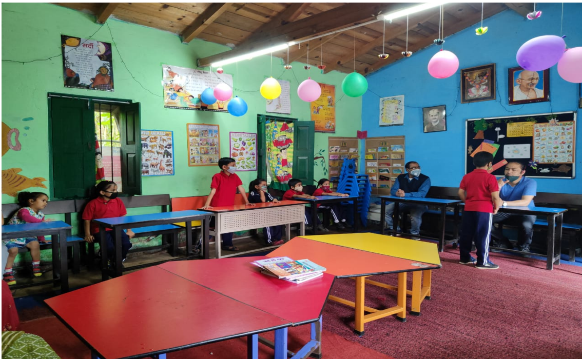
Interaction with primary students