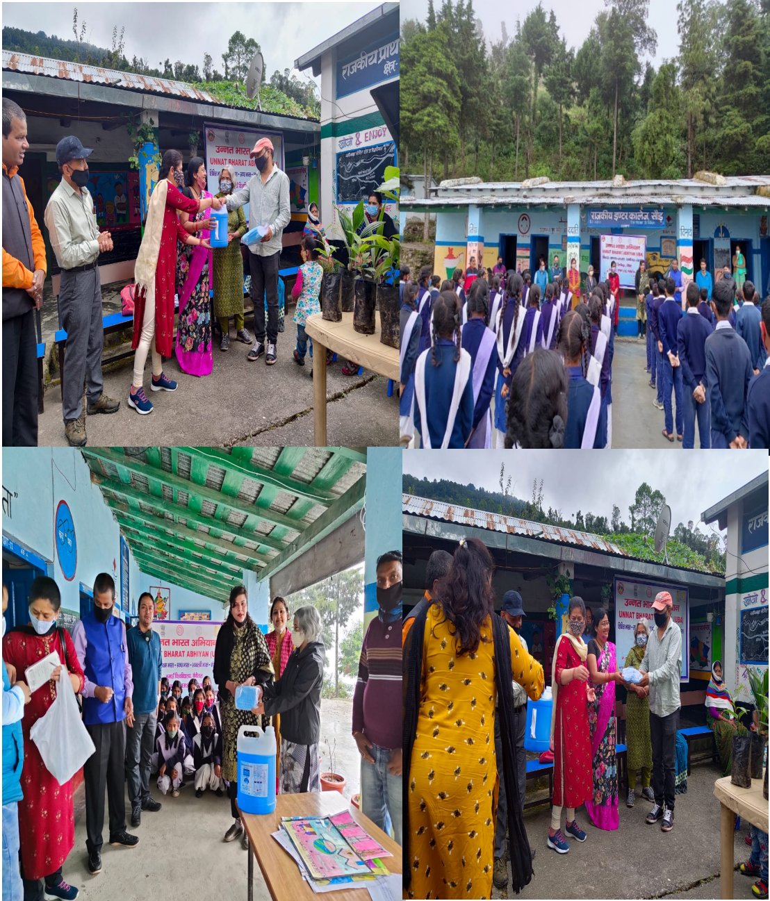
Distribution of masks and sanitizers by UBA team